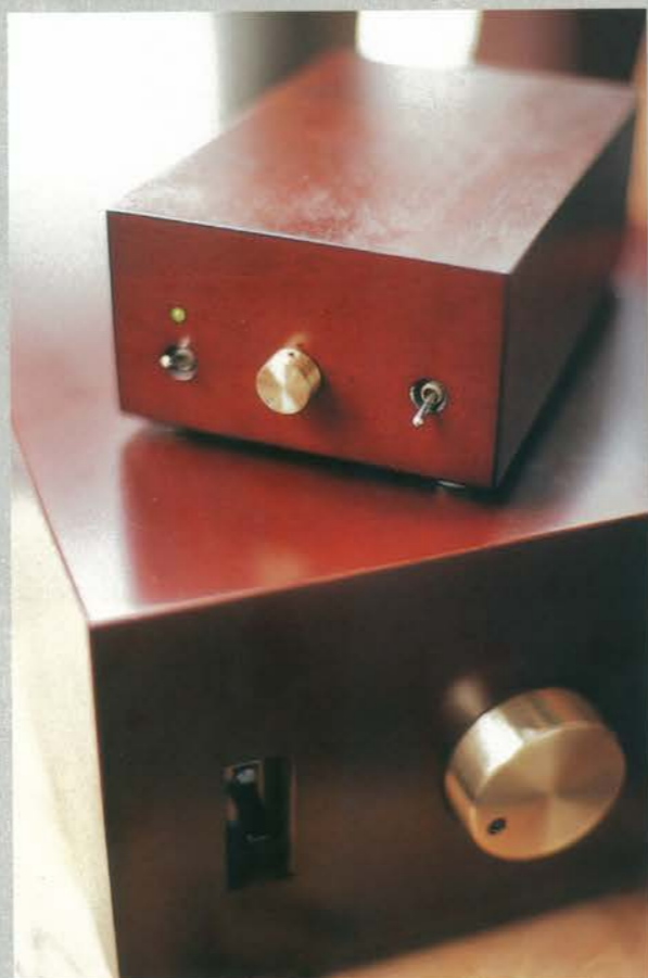
上/家族みんなで一つひとつ手作りしている。左/アンプはON/OFFスイッチと切り替えスイッチ、ボリュームだけ。10W×2アンプ「健」+8cmスピーカー (CDプレイヤー付き・20万円)。50W×2アンプ「調」+12cmスピーカー (53万円)。